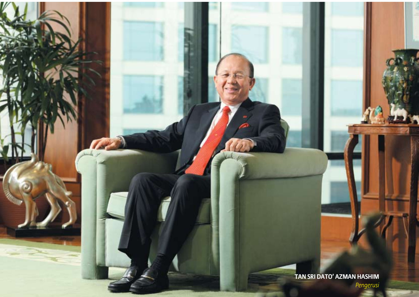
TAN SRI DATO' AZMAN HASHIM Pengerusi

“ Tahun kewangan yang baru berakhir pada 31 Mac 2008 menandakan satu lagi pencapaian penting. Ia merupakan satu tahun yang penuh dengan kejayaan di mana kami berjaya menyampaikan komitmen dan nilai kepada pemegang saham melalui keuntungan yang lebih tinggi, dividen yang lebih tinggi dan mengukuhkan kedudukan kami untuk meningkatkan Kumpulan AmBank demi pertumbuhan dan kestabilan masa depan. ”